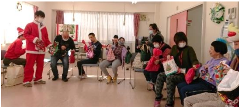
プレゼント交換 サンタクロース登場！？

昼食は、あらかじめ皆さんに希望を聞いて注文しておいた弁当とケーキを作業所内で食べ、その後は会場を3か所に分け、それぞれの会場でプレゼント交換やゲームなどをして楽しみました。最後にメンバーさんのマジックの披露もあり、楽しいクリスマスを過ごしました。