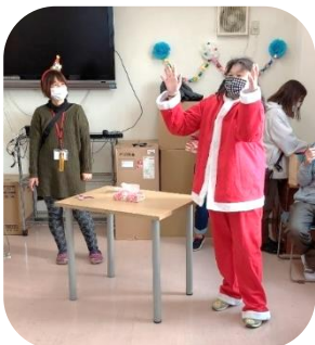
練習を重ねたマジック披露。大成功