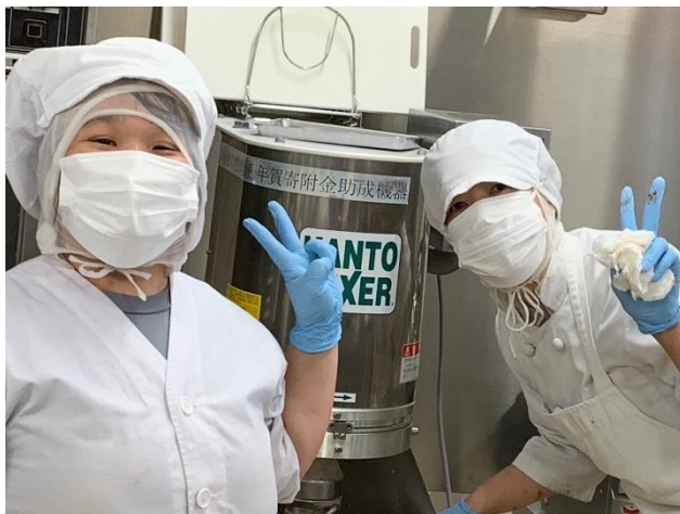
クッキーづくり、頑張ってるよ

この4年間は、ほとんどコロナに翻弄される日が続いたといっても過言ではない。就任時に開いた理事会・評議員会を最後にそれからの3年間はずっと書面表決、今年の2月から、やっと理事会、評議員会で役員が集まったと思ったら、先日の決算総会は第9波に入ったかもしれないとのことで延期することになった。コロナ対応は一体いつまで続くのか、「Withコロナ」が当たり前のことになっていくのかもしれない。